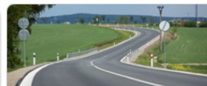
Doprava a mobilita