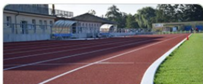
Volnočasové aktivity a sport