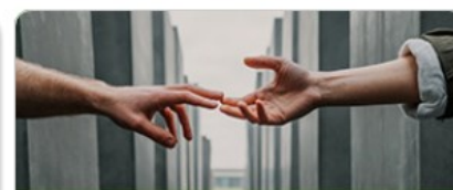
Sociální oblast a zdravotnictví