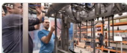
Podnikání a inovace