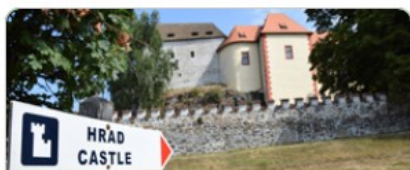
Kultura a památková péče