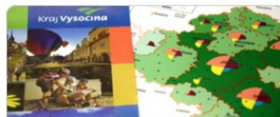
Regionální rozvoj a veřejná správa