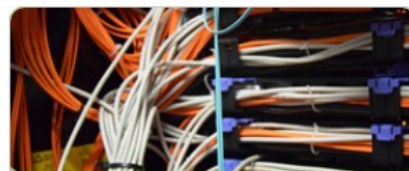
Informační a komunikační technologie