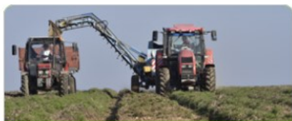
Životní prostředí a zemědělství